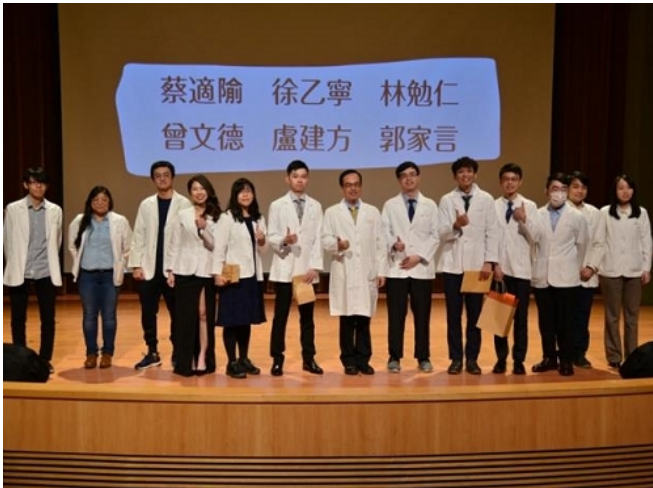
師長為M112授袍，並由大六學長姐加袍，並合影留念