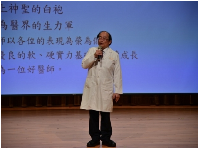
方基存主任致詞，給予M112同學祝福勉勵