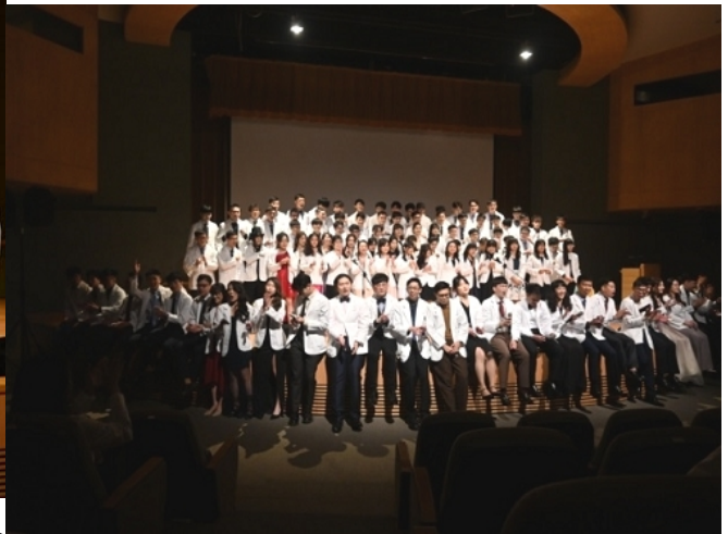
白袍歌「長庚今天又起霧了」M112大合唱